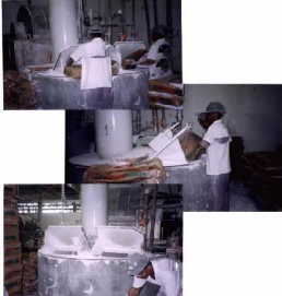
Situação depois da instalação em moega manual/rodoviária com aplicações de abafadores.