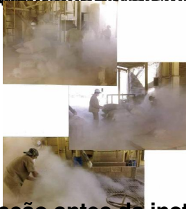
Situação antes da instalação