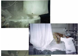
Situação antes da instalação