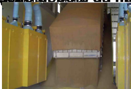
Situação antes da instalação