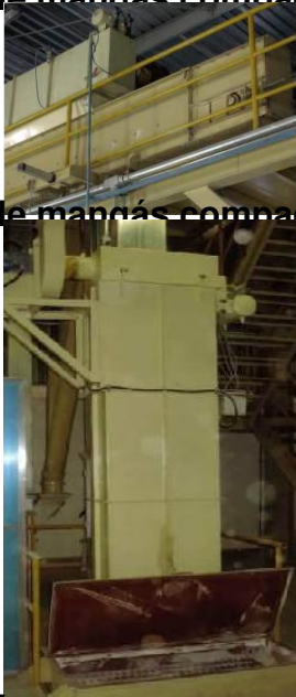
Filtro de mangas compacto aplicado a redler ou rosca.