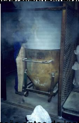
Situação antes da instalação