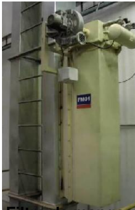
Filtro de mangas compacto aplicado a elevador de canecas.